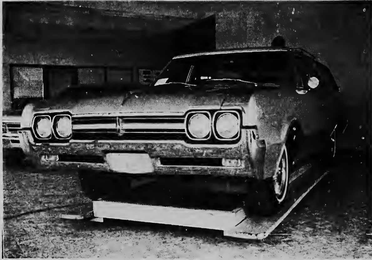
Ayerá Isa Sales & Agencies tabatin e modelnan Oldsmobile 1966 y Acadlan 1966 den e showroomnan na Habaal y Saliña. Un numeroso publico a hasi uso di e oportunidad pa mira e promer modelonan di e prestigioso marcanan aki, qu e aña aki a bini cu cambionan di estilo qu a refina apariencia di e autonon aki. E modelo aki riba ta un stationwagon qu a ser exhibi den e showroom na Habaal y a hala hopi atencion.